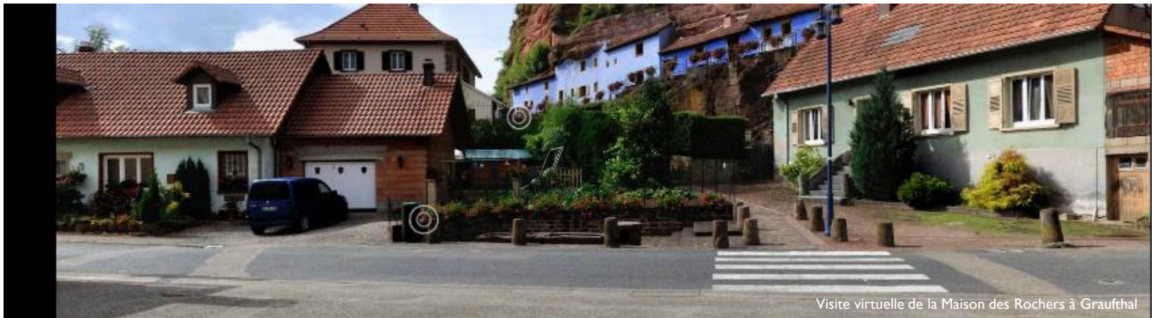
Visite virtuelle de la Maison des Rochers à Graufthal