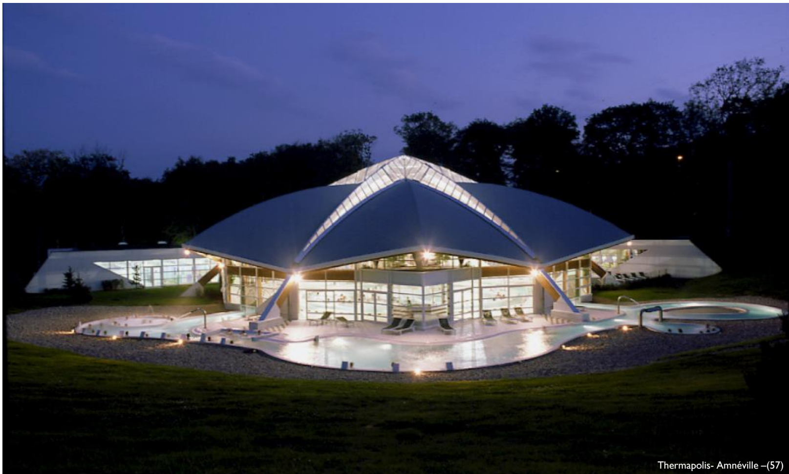
Thermapolis- Amnéville -(57)