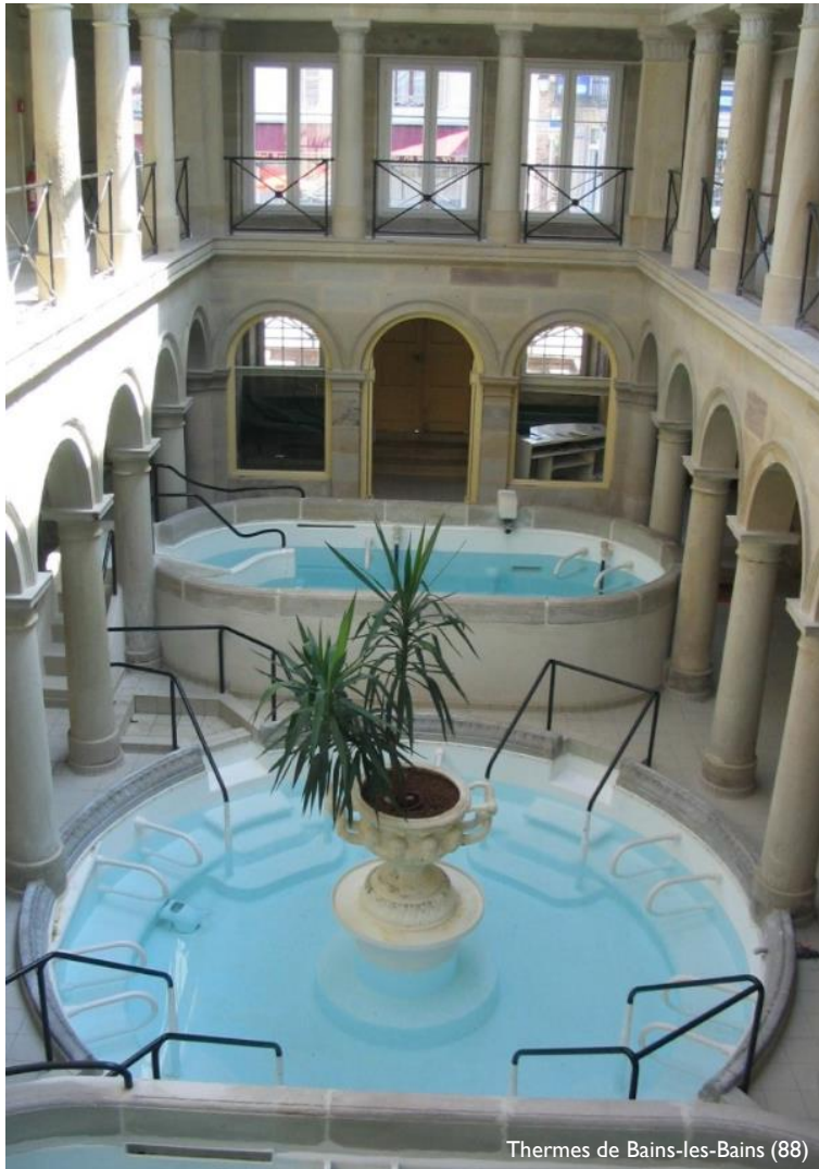
Thermes de Bains-les-Bains (88)