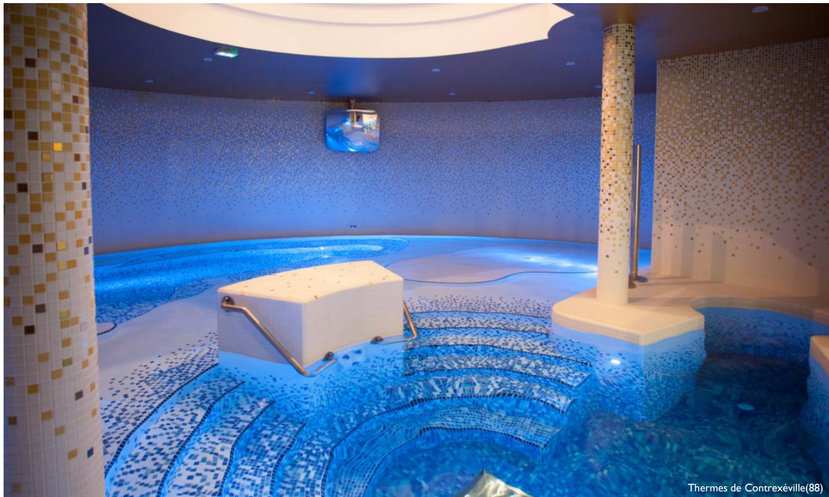
Thermes de Contrexéville(88)