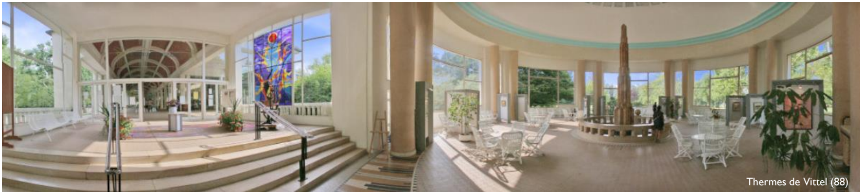
Thermes de Vittel (88)