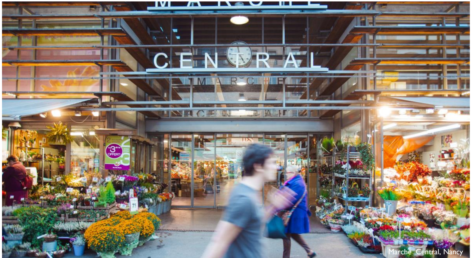
Marché Central, Nancy