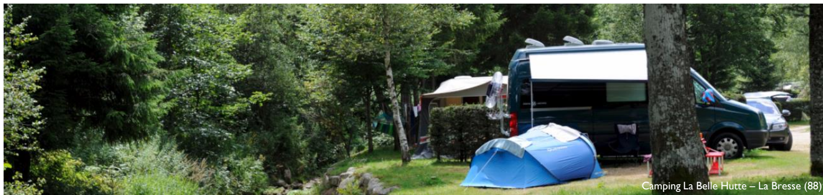
Camping La Belle Hutte – La Bresse (88)

Source : INSEE - Données définitives 2015 Observatoire Régional du Tourisme d'Alsace , Observatoire Régional du Tourisme de Champagne-Ardenne, Observatoire Lorrain du Tourisme