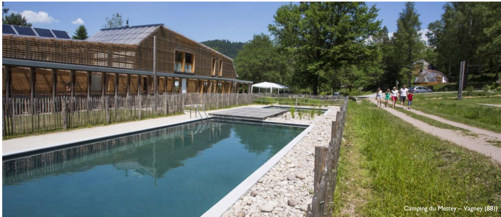
Camping du Mettey – Vagney (88)