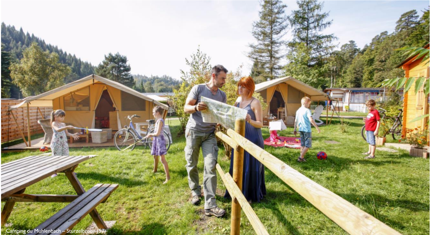
Camping du Muhlenbach – Sturzelbronn (57)