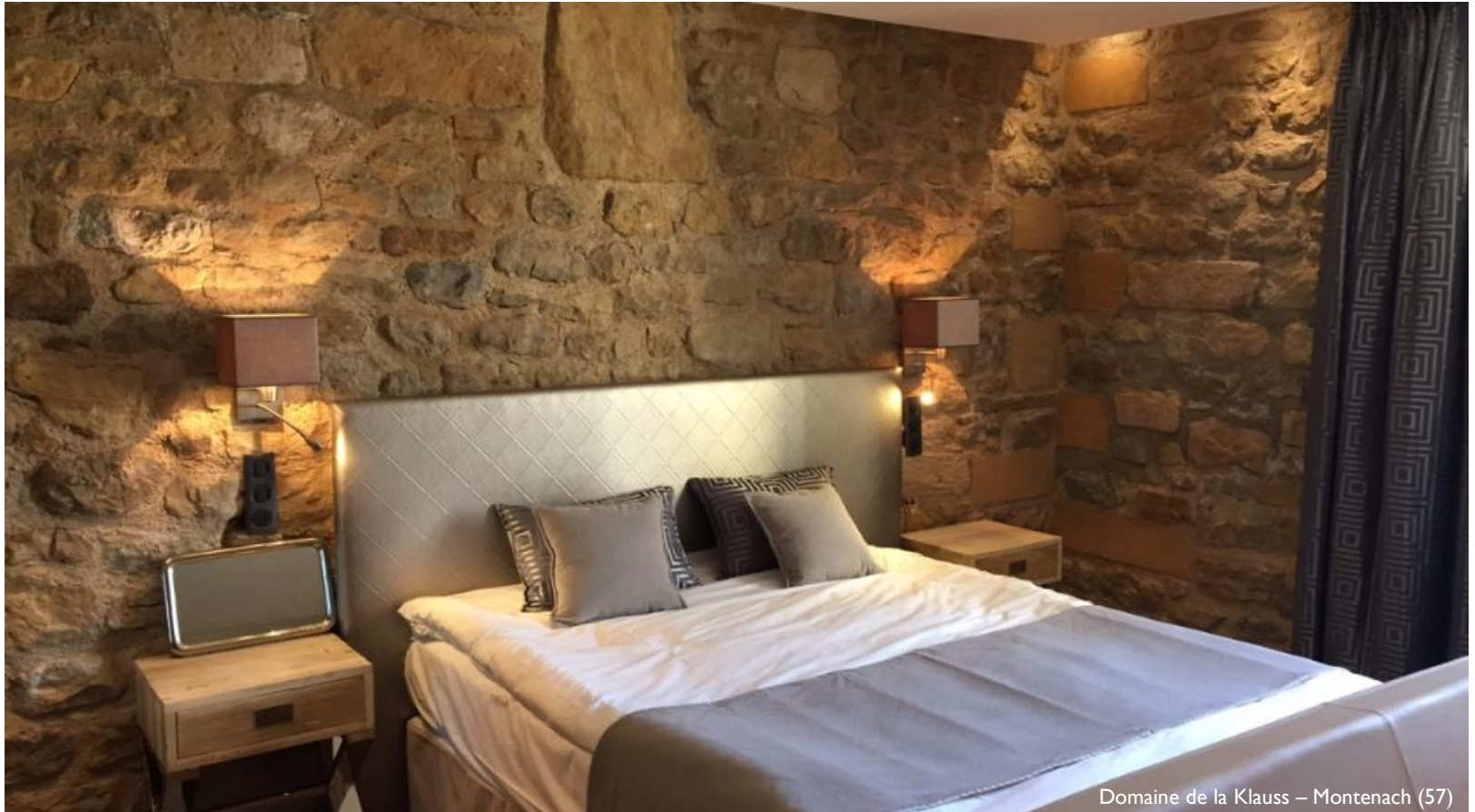
Domaine de la Klaus – Montenach (57)