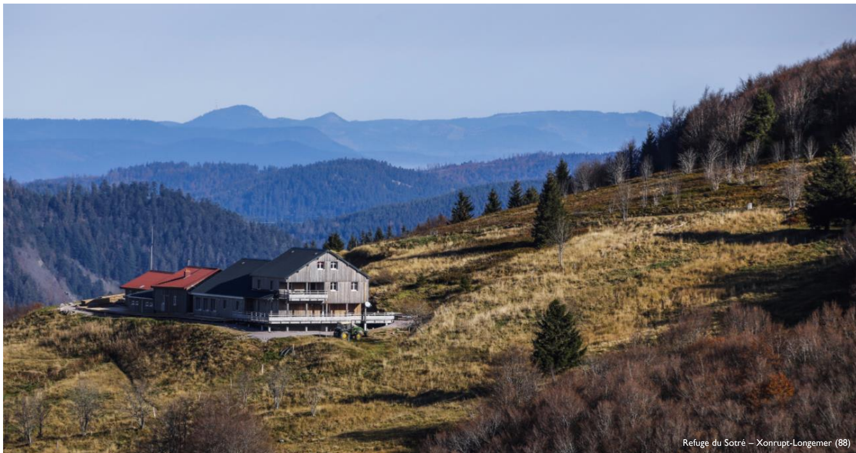
Refuge du Sotrè – Xonrupt-Longemer (88)