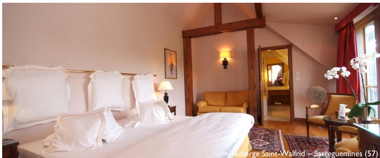
Auberge Saint-Walfrid – Sarreguemines (57)

Traitement : Observatoire Lorrain du Tourisme