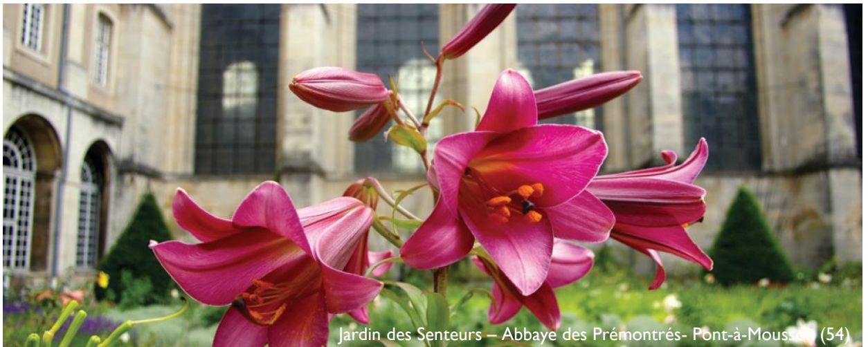
Jardin des Senteurs – Abbaye des Prémontrés- Pont-à-Mousson (54)